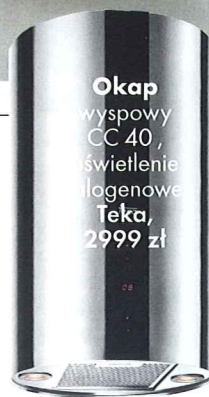
Okap wyspowy CC 40, świetlenie logenowe Teka, 2999 zł