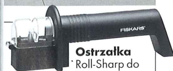
Ostrzałka Roll-Sharp do noży Fusion, Fiskars, ok. 40 zł