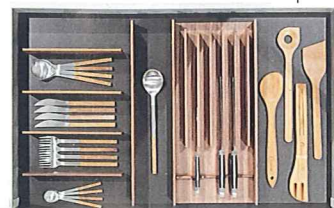
Szuflada na sztućce, Poggenpohl, 1800 zł