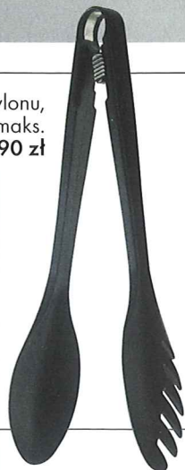
Szczypce z nylonu, do temperatury maks. 220°C, Muji, 39,90 zł