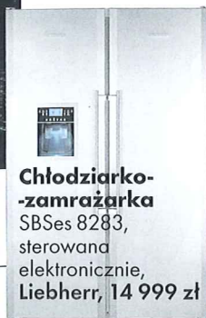
Chłodziarko-zamrażarka SBSes 8283, sterowana elektronicznie, Liebherr, 14 999 zł