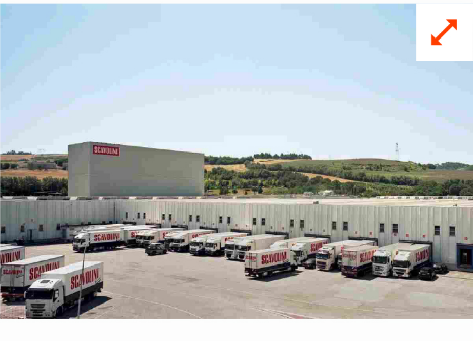
6 Il sito produttivo di Montelabbate in uno scatto di Gabriele Basilico.