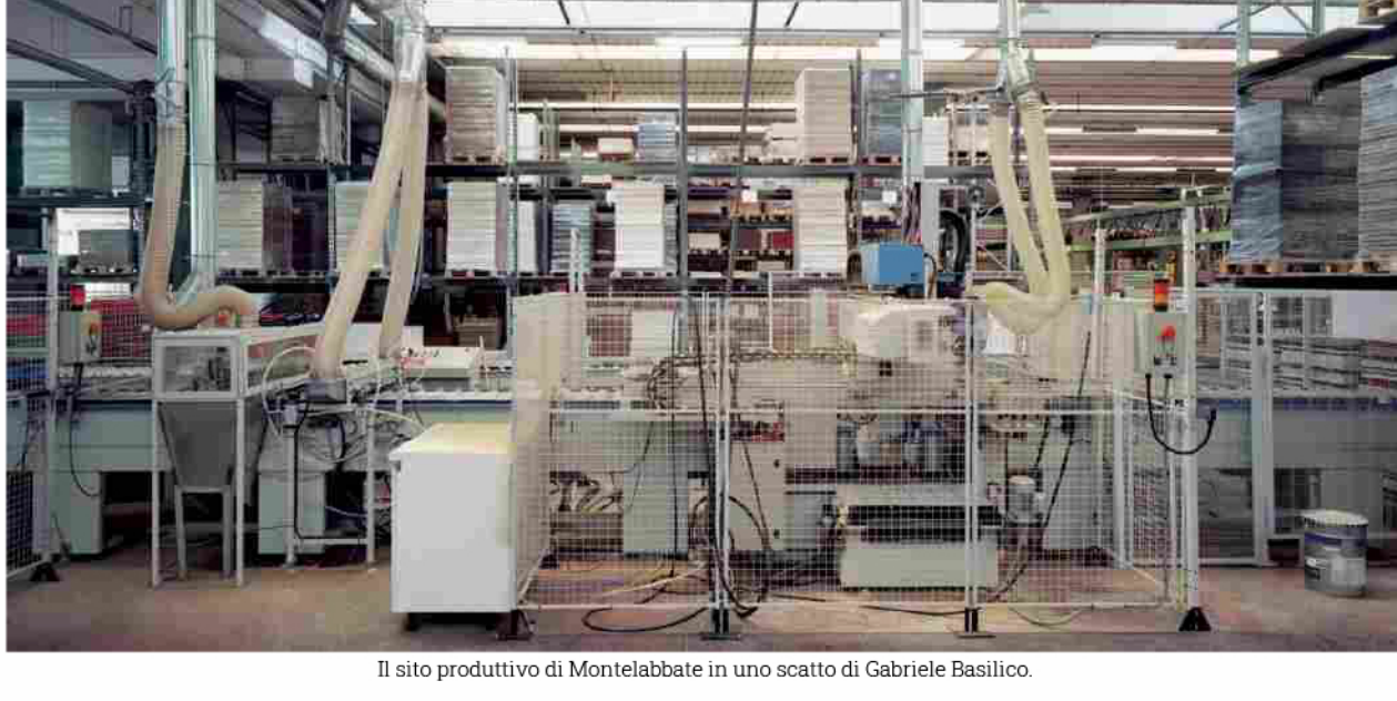
Il sito produttivo di Montelabbate in uno scatto di Gabriele Basilico.