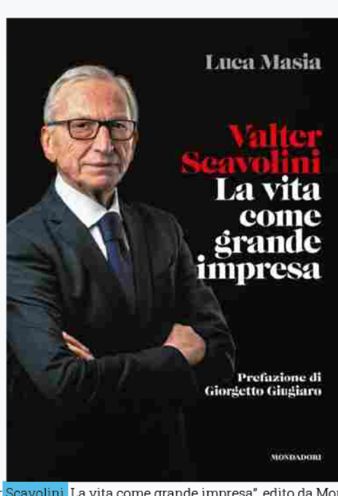
La cover del volume "Valter Scavolini La vita come grande impresa", edito da Mondadori Electa a cura di Luca Masia.

S essanta anni di lavoro sono una strada lunga. Servono a capire quanto è stato fatto nel corso del tempo e quanto resta ancora da fare per il futuro. Ci sono date nella vita di un'azienda che riportano la memoria a quando tutto è iniziato. L'origine di ogni avventura imprenditoriale ha una componente di mito, piccola o grande. Ognuna merita una celebrazione. Ognuna può diventare occasione di riflessione e ripartenza.